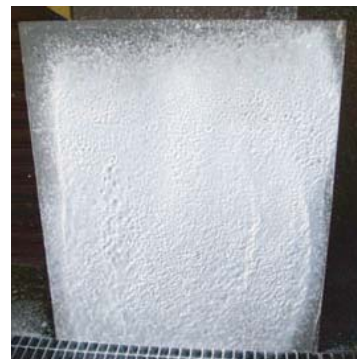
※写真はステンレス板に噴射時のものです。